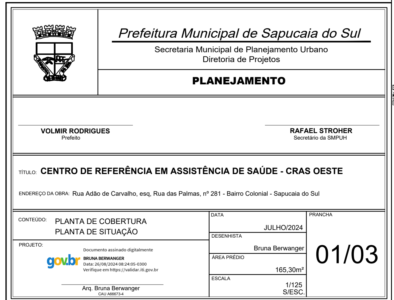
PLANTA COBERTURA ESC. 1/125

ESTE DOCUMENTO FOI ASSINADO EM: 27/08/2024 12:43 -03:00 -03 PARA CONFERÊNCIA DO SEU CONTEÚDO ACESSAR: https://c.atende.net/p66cc906880788