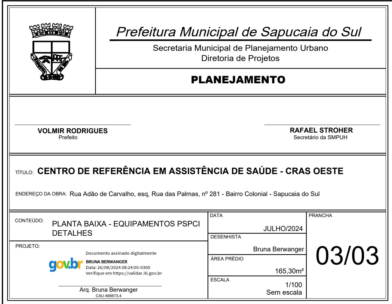
PLANTA BAIXA - PSPCI ESC. 1/125

Expediente Administrativo: 6854/2024 Aprovado em: 22/03/2024 Observações: Projeto aprovado por Deni Schmidt. Assinatura digital avançada com certificado digital não ICP-Brasil.