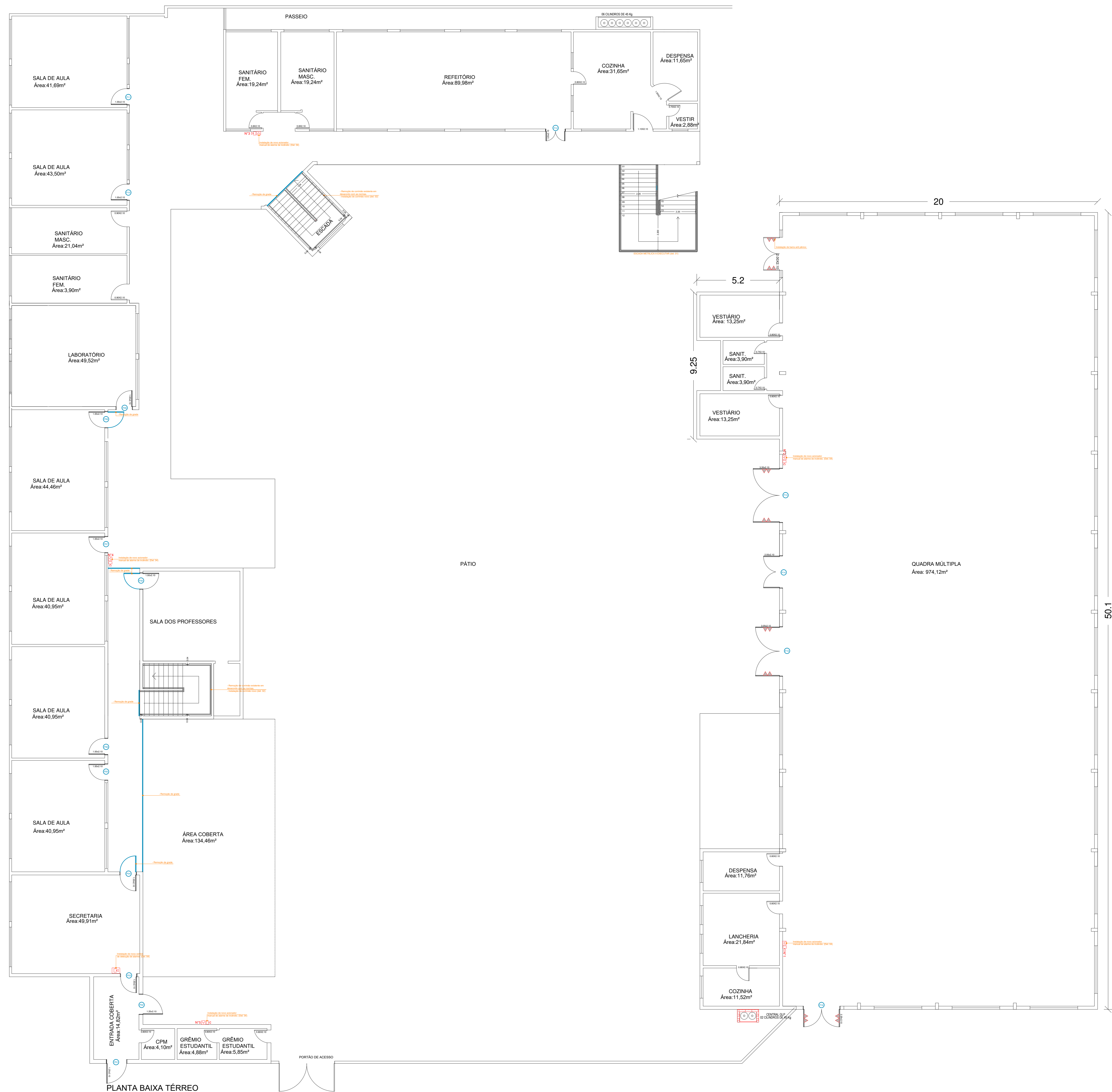
PLANTA BAIXA TÉRREO ÁREA: 1.822,88m² ESC: 1/100