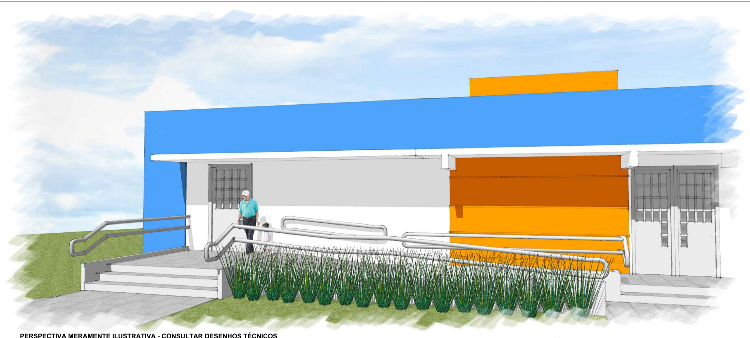
PERSPECTIVA MERAMENTE ILUSTRATIVA - CONSULTAR DESENHOS TÉCNICOS