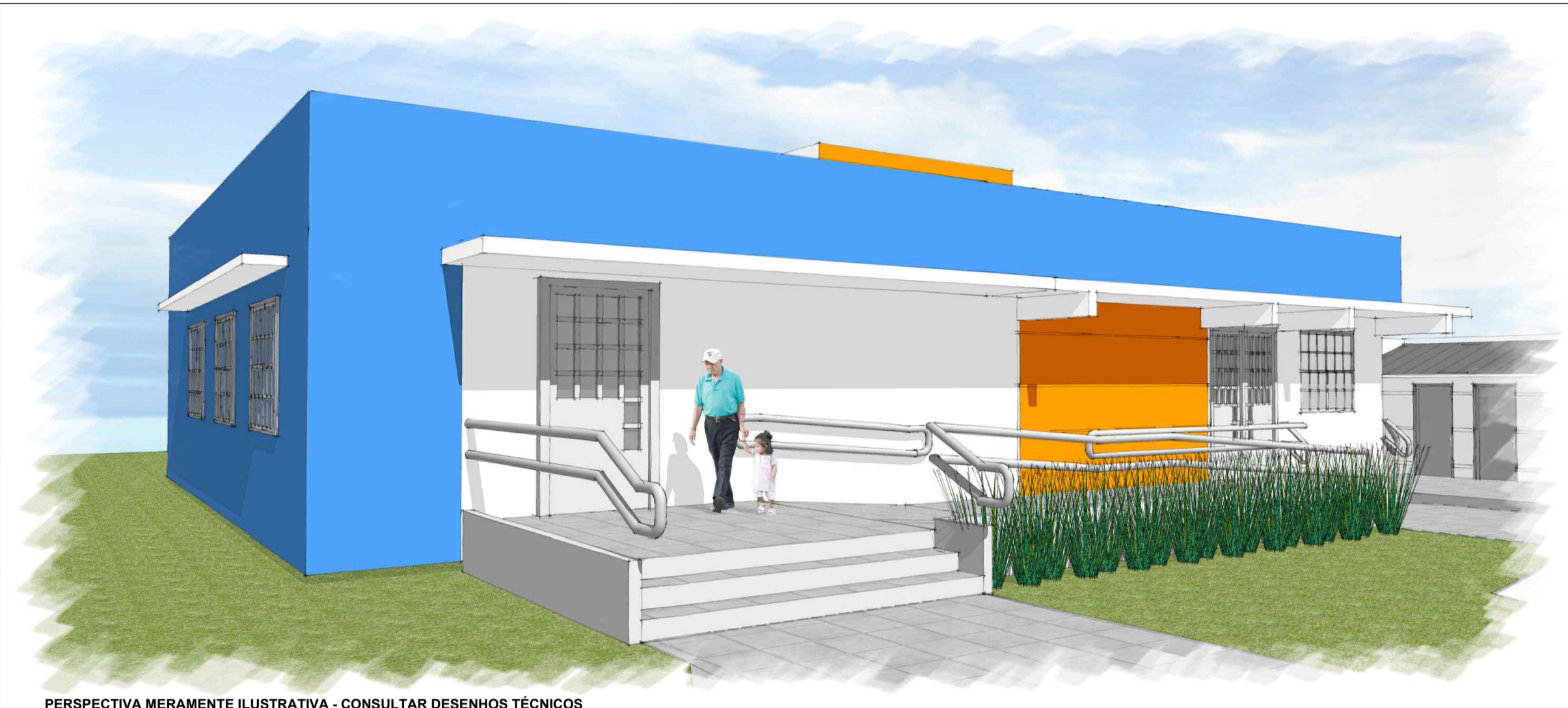
PERSPECTIVA MERAMENTE ILUSTRATIVA - CONSULTAR DESENHOS TÉCNICOS